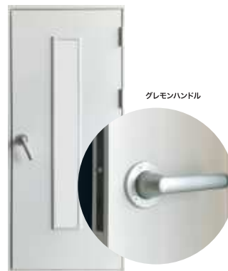
グレモンハンドル